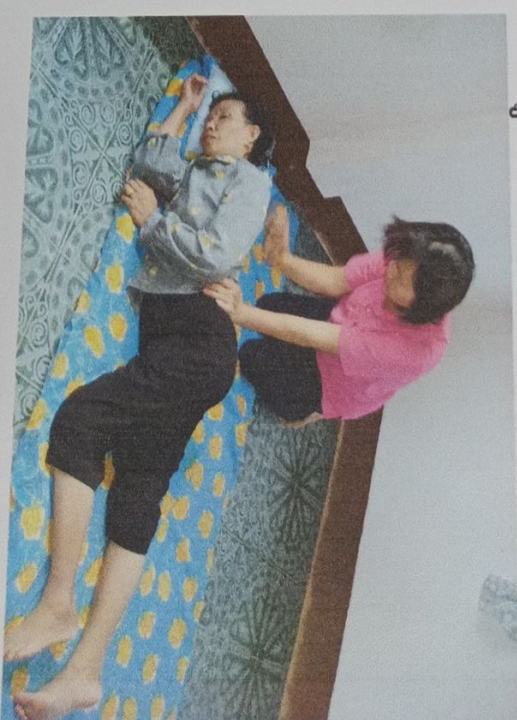
การให้บริการนวดแผนไทย